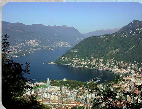
Il Lago di Como e le sue ville