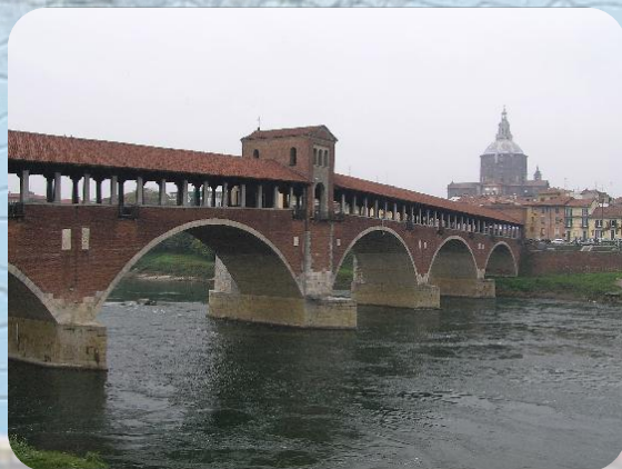
Pavia e la Certosa