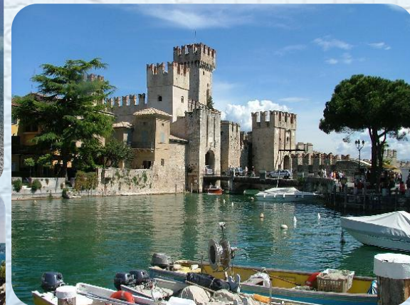
Sirmione e le Grotte di Catullo